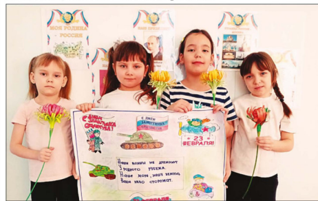
Воспитанники детского сада «Солнышко»

День защитника Отечества отмечают не только военно-служашие, но и все представители сильного пола. Даже если они еще маленькие и ходят в детский сад. В группах традиционно проводятся утренники, готовятся подарки от детей для пап и девушек. Кроме того, воспитанники дошкольной ступени МБОУ «Школа имени Гоньшева А.И.» приготовили небольшие подарки мальчикам на 23 февраля. Ведь они будущие защитники, а значит – это и их праздник!